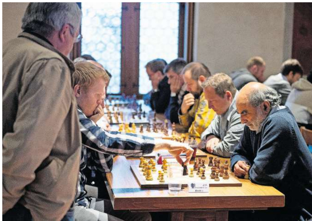
Hochkonzentriert: Schachspieler im Surseer Rathaus.

Bild: Corinne Glanzmann (Sursee, 7. Dezember 2019)